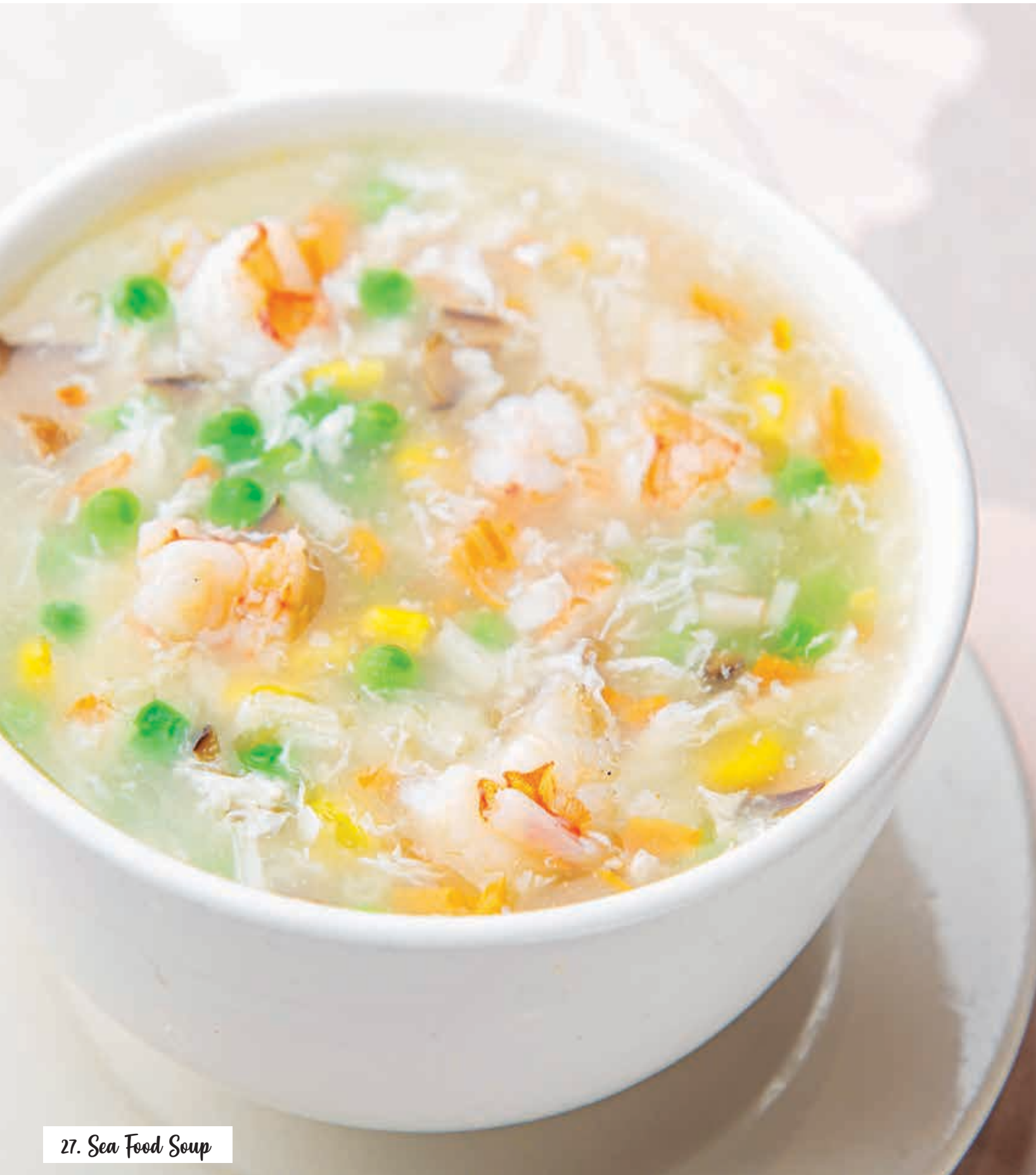
27. Sea Food Soup