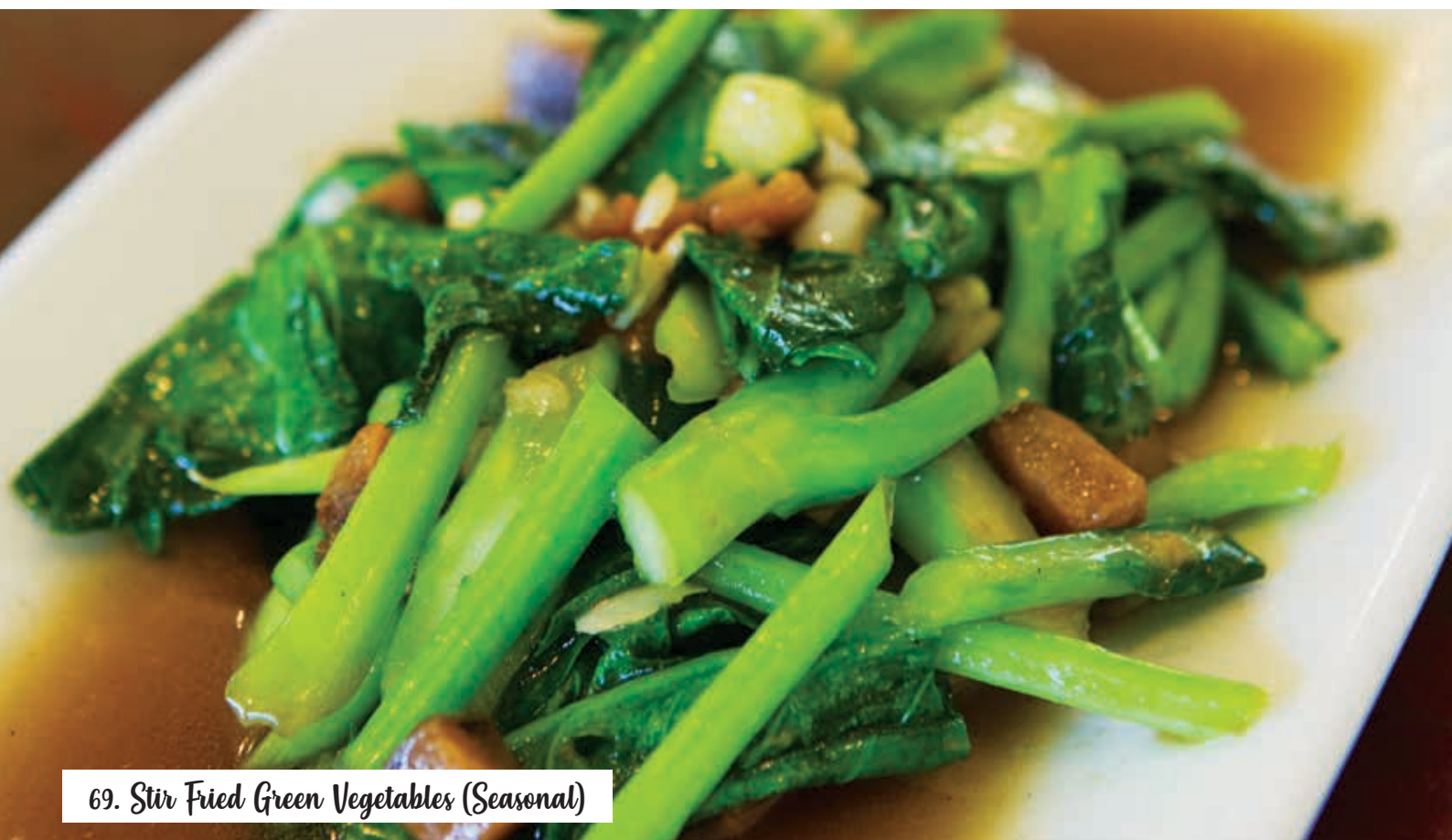
69. Stir Fried Green Vegetables (Seasonal)