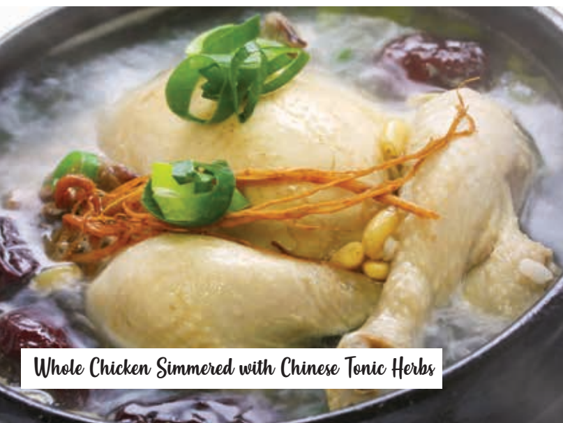
Whole Chicken Simmered with Chinese Tonic Herbs