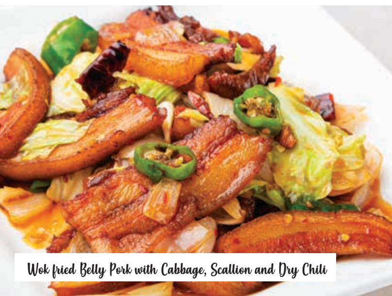
Wok fried Belly Pork with Cabbage, Scallion and Dry Chili