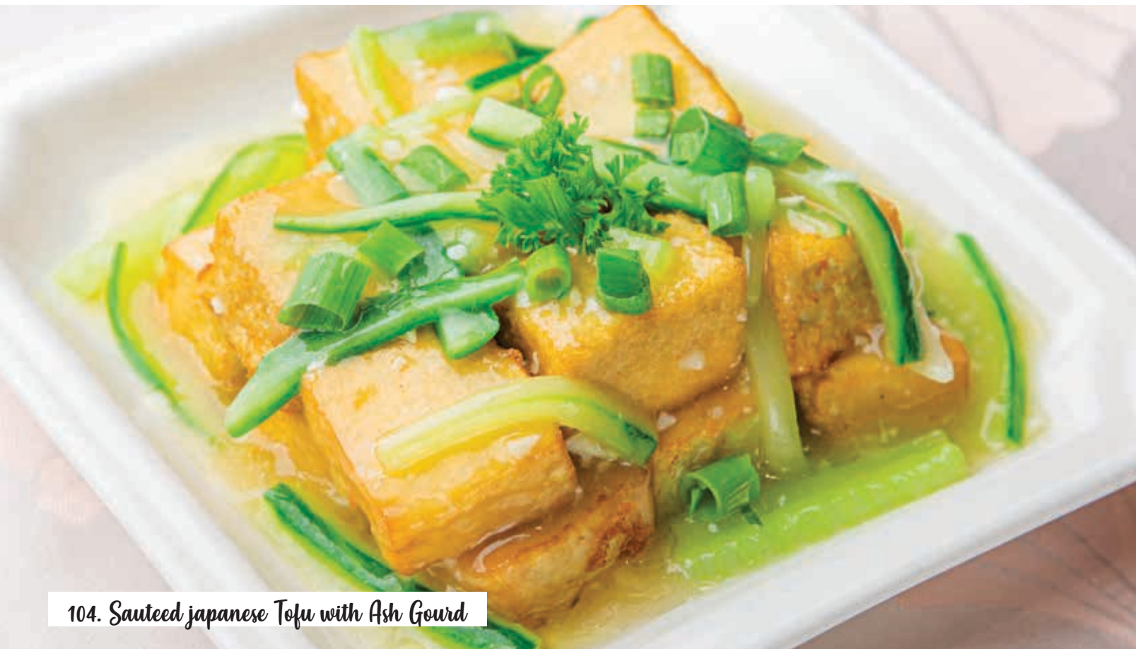
104. Sauteed Japanese Tofu with Ash Gourd