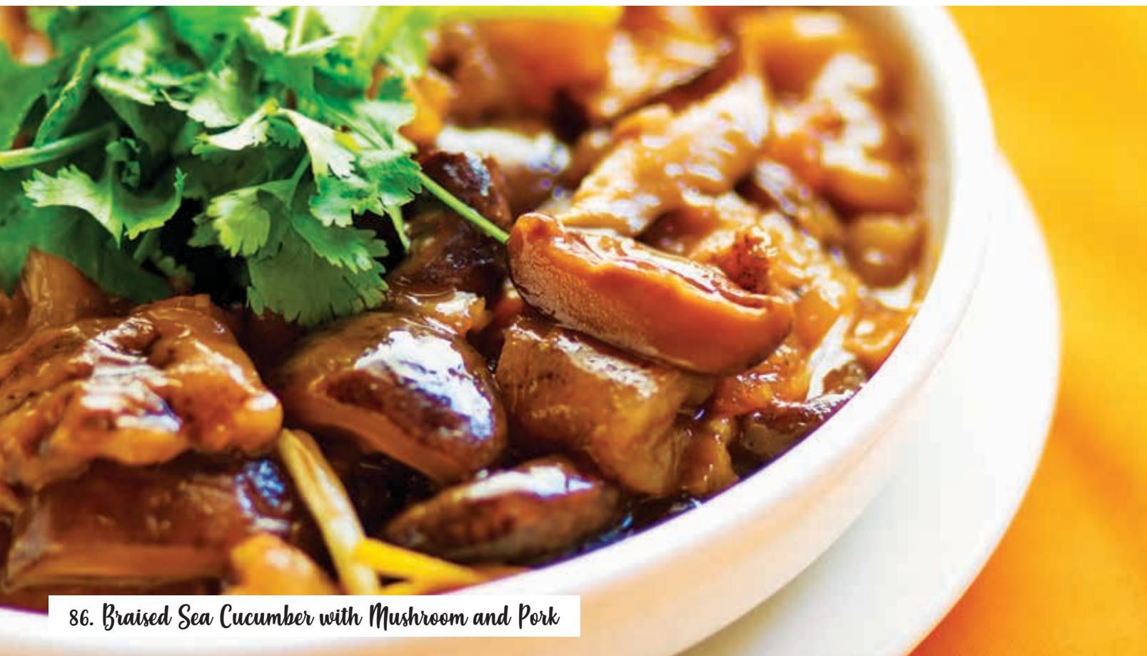
86. Braised Sea Cucumber with Mushroom and Pork