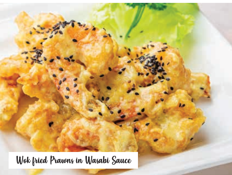
Wok fried Prawns in Wasabi Sauce