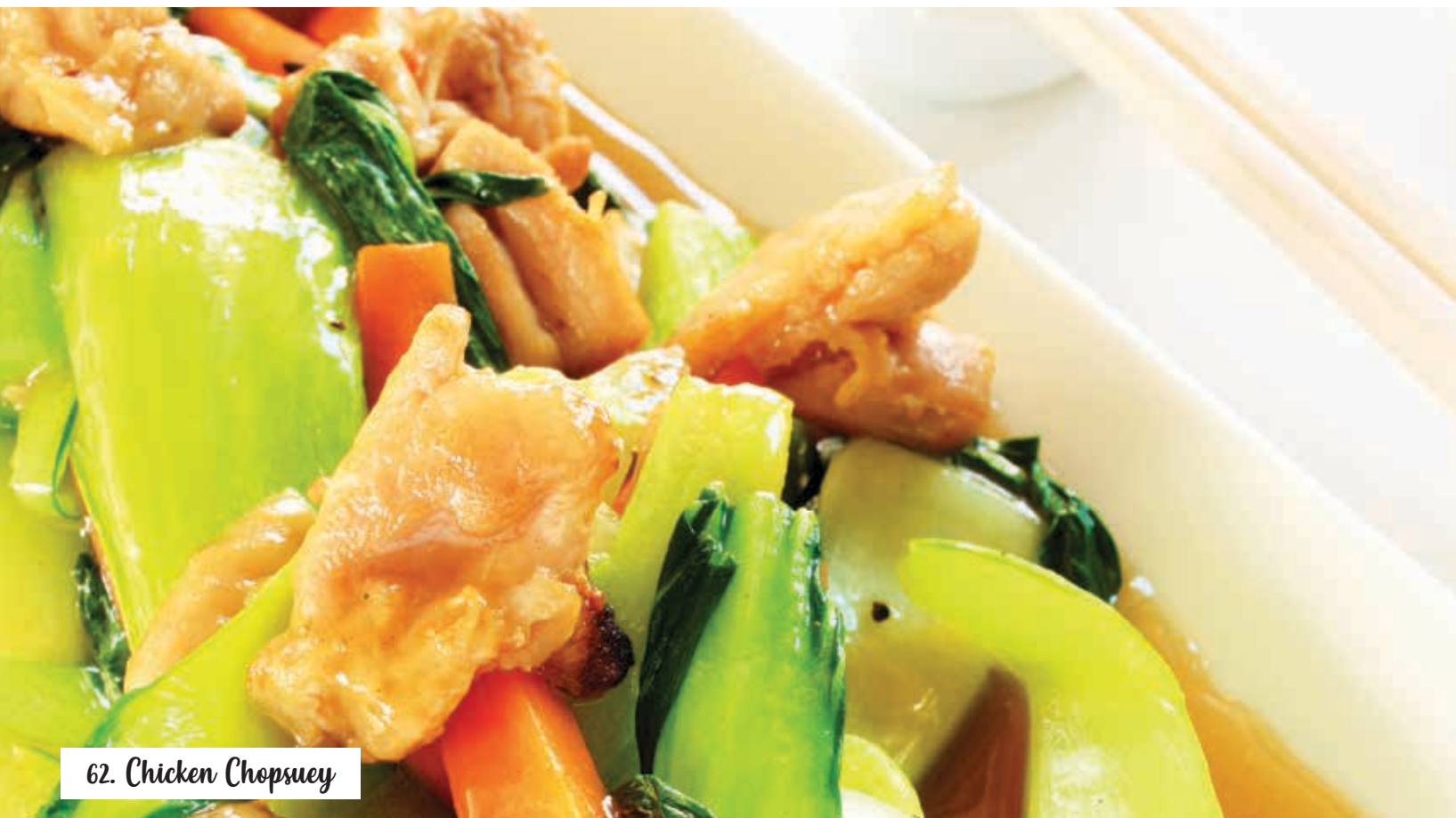
62. Chicken Chopsuey