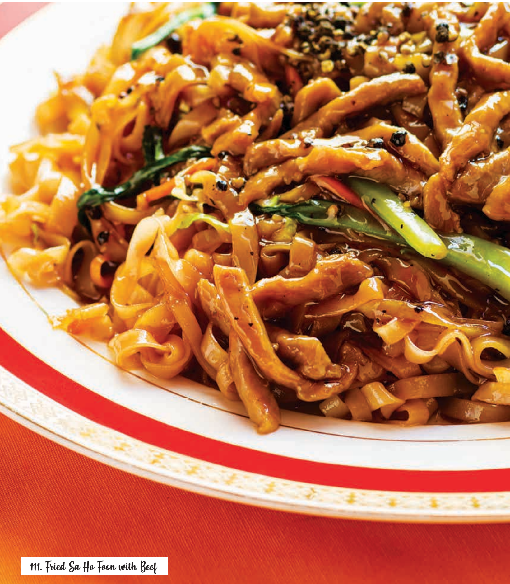
111. Fried Sa Ho Foon with Beef