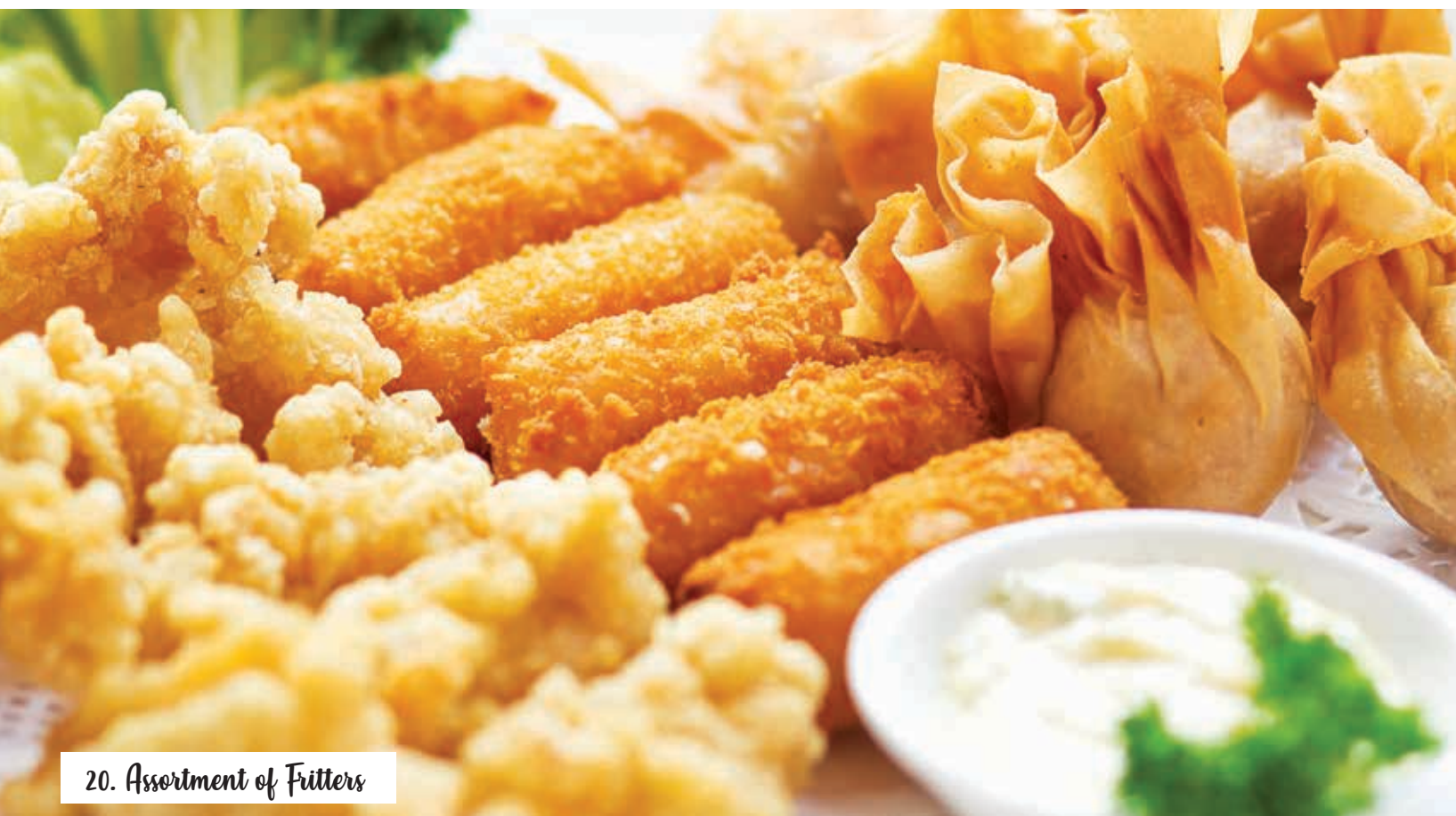
20. Assortment of Fritters