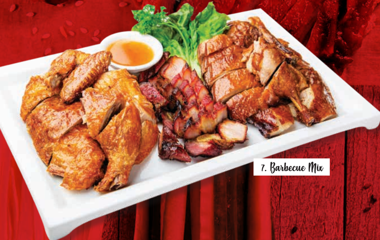
7. Barbecue Mix