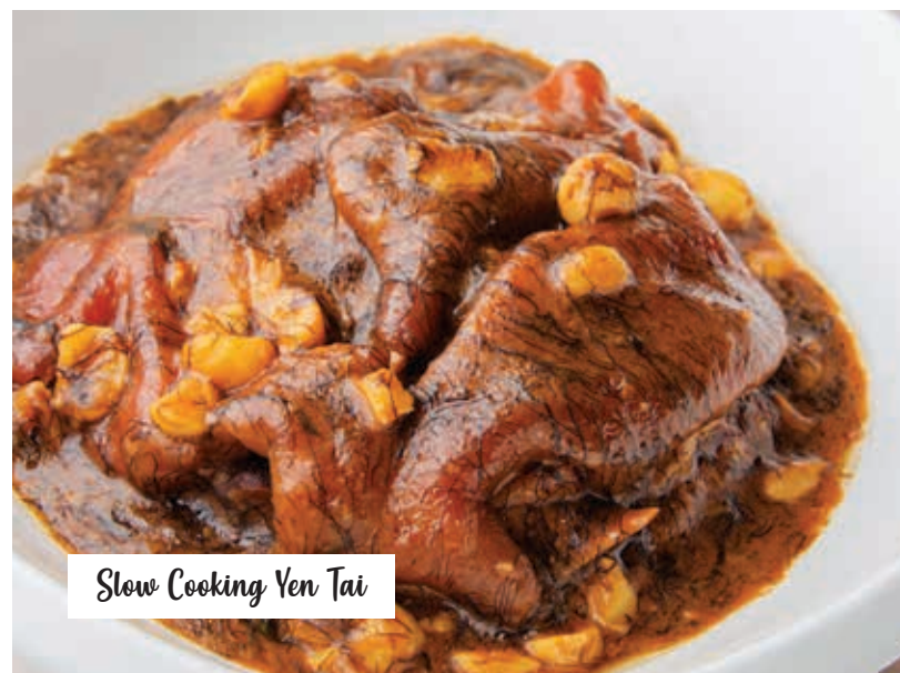
Slow Cooking Yen Tai