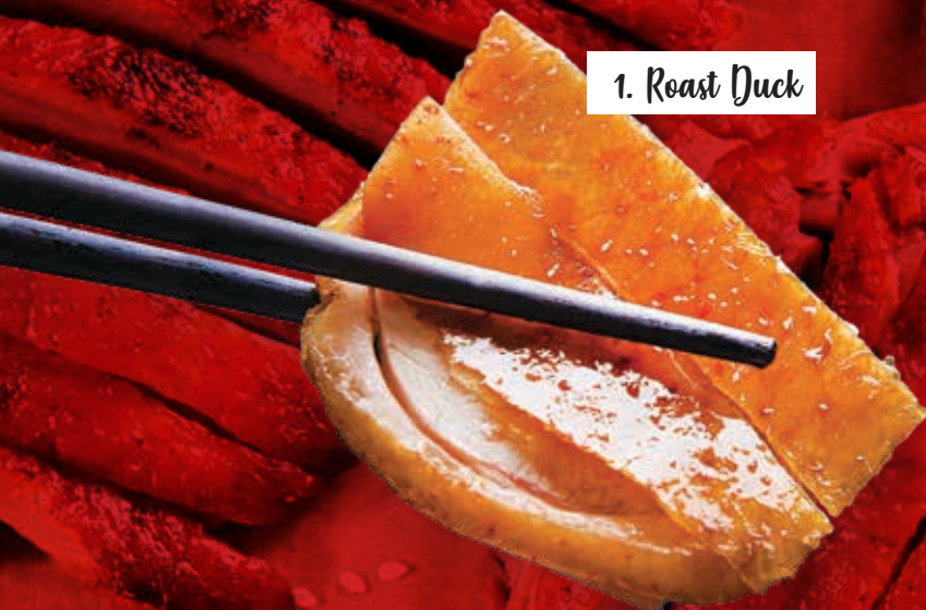
1. Roast Duck