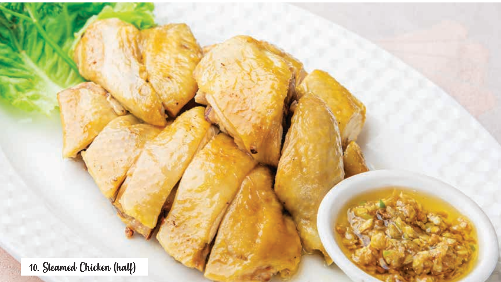
10. Steamed Chicken (half)