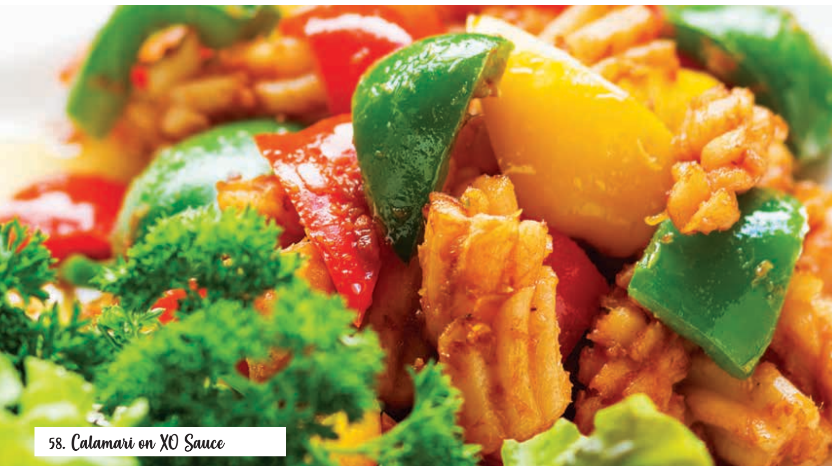
58. Calamari on XO Sauce