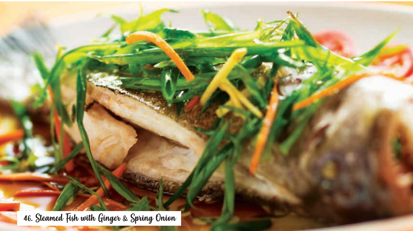
46. Steamed Fish with Ginger & Spring Onion