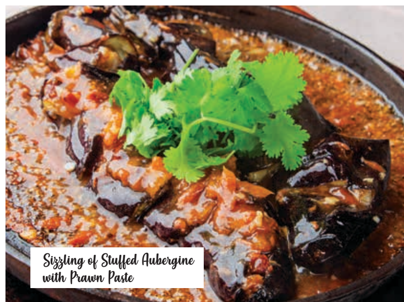
Sizzling of Stuffed Aubergine with Prawn Paste

Double Boiled Spare Ribs with Chinese Herbs in Broth 汤中草藥排骨 1350